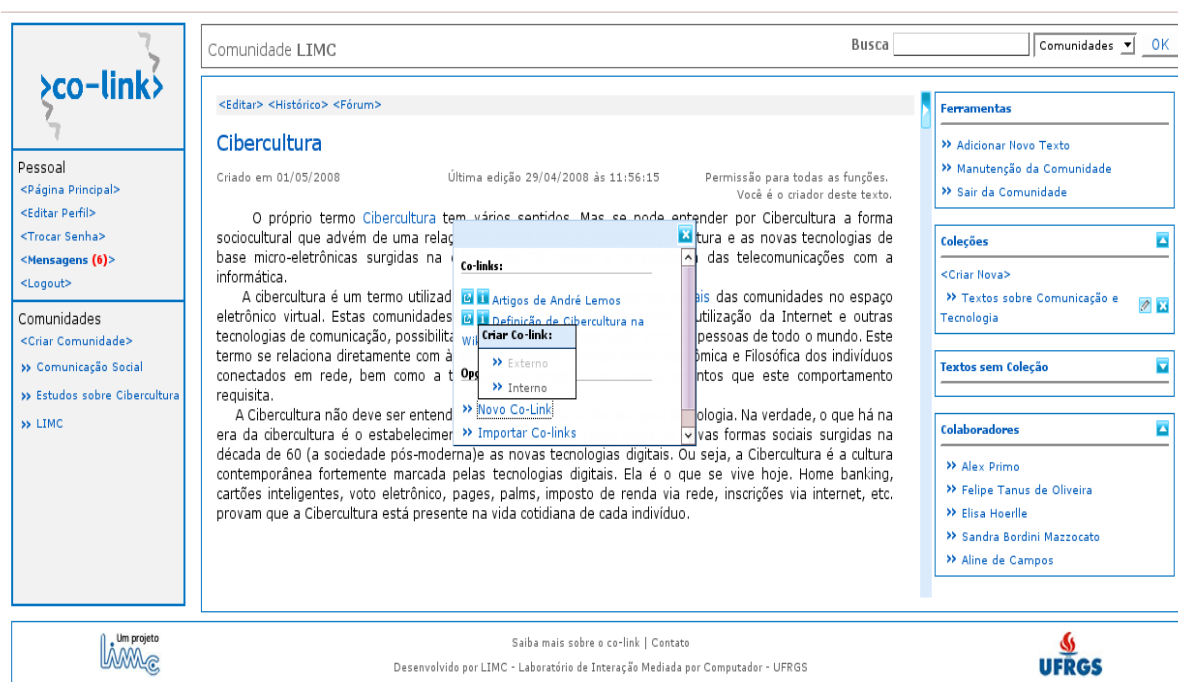
Figura 1. Modelo de inserção de co-links a um link existente.

Nas palavras ou expressões que já contém links com seu conjunto de Co-links , é possível, além de acrescentar novos apontadores, visualizar informações sobre cada destino, como data, horário e o interagente que realizou aquela colaboração (Figura 1). Também se pode editar ou apagar estas informações, operações necessárias no sentido de apagar links descontextualizados, desnecessários ou até mesmo ofensivos em algum sentido.